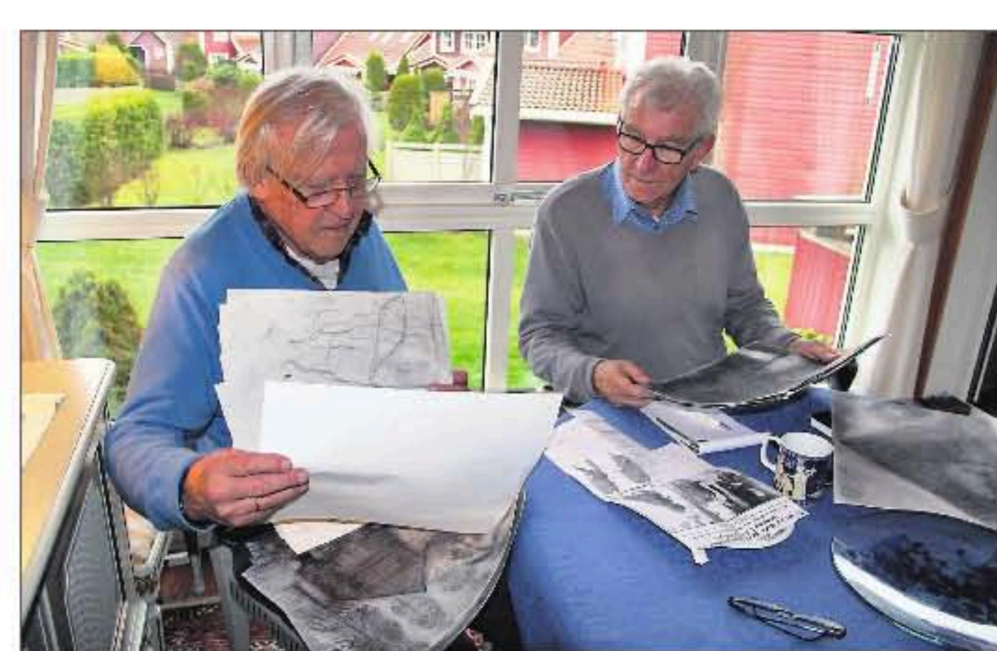
UTVELGELSE: Det er ikke lett å velge hvilke motiver som skal med i kunstboka om Haakon Engelsen. Det er 100-talls motiver å velge mellom - her er det kulltegninger som diskuteres.